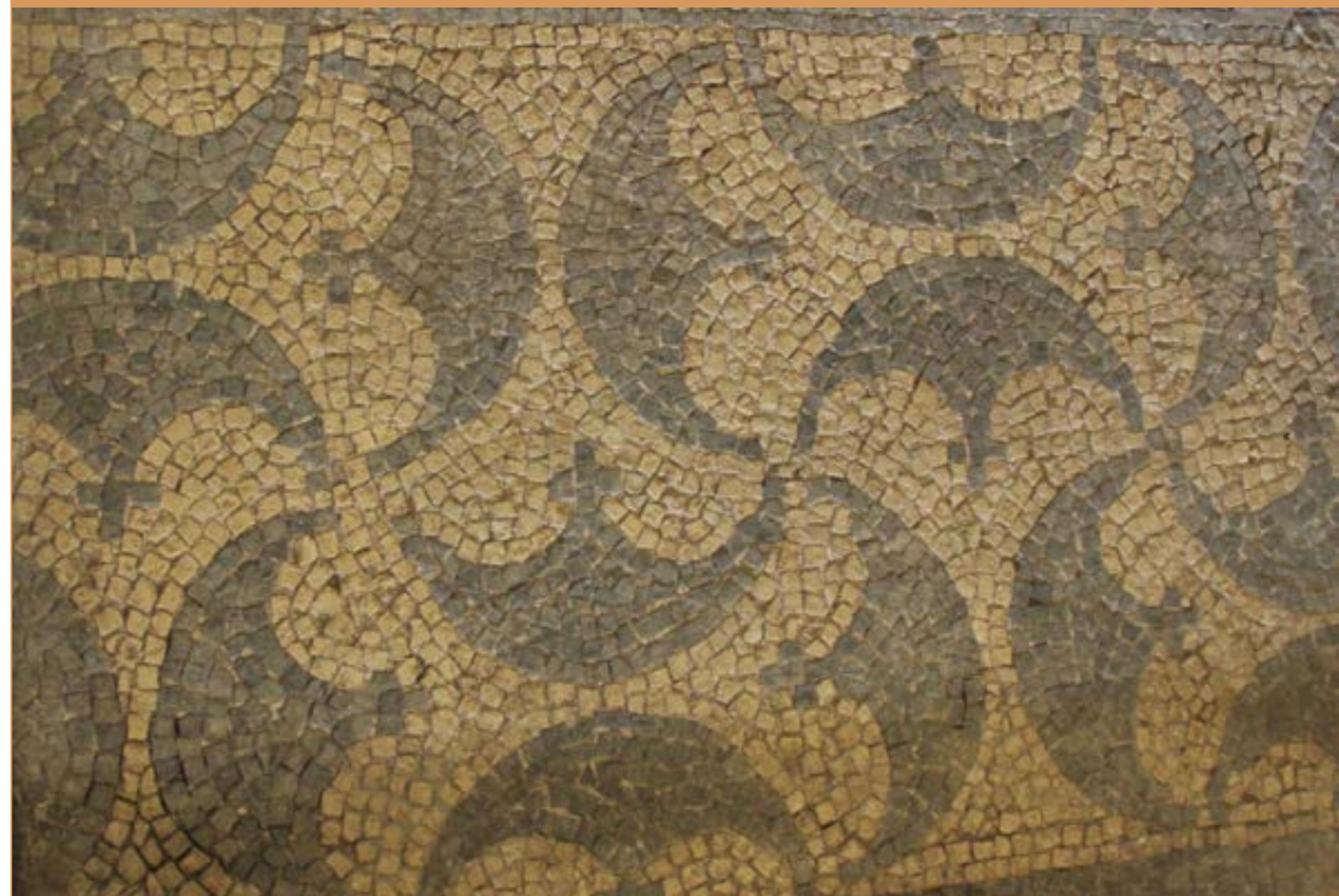
Image : fragment de mosaïque provenant du site conservé au Musée d'Yverdon et Région.

Toute information sera la bienvenue. D'avance merci pour votre collaboration. Contact : F. Fischer 076 391 68 82 (tous les jours dès 17 heures).