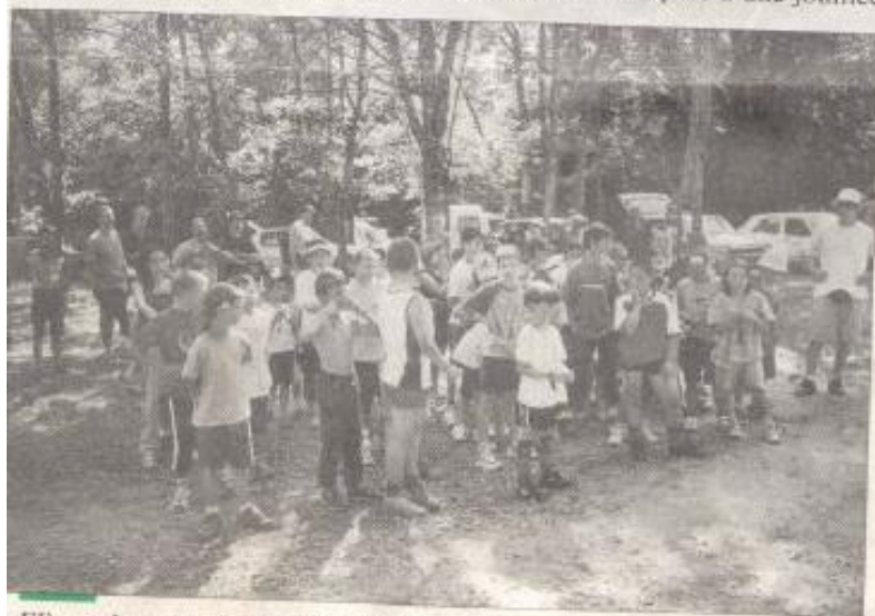
Élèves cheyrois et Saint-Martialais lors des épreuves sportives.

Saint-Martial ne compte que 165 habitants et est de plus assez isolé. Le village ne compte qu'une ou deux sociétés seulement. Le jumelage est beaucoup apprécié par les habitants de Saint-Martial qui à chaque fois se donnent beaucoup de peine pour recevoir et accueillir les Cheyrois. Les élèves de Saint-Martial vont sans doute venir à Cheyres pour la suite de cet échange scolaire à une date qui reste à définir. Une semaine sans doute inoubliable pour les élèves de 4 e année de l'instituteur Joël Chardonnes.