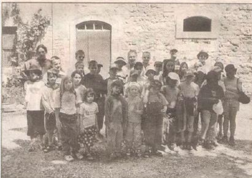
Les élèves de Cheyres et de Saint-Martial réunis avec leurs accompagnants lors de leur sortie en Camargue.

Saint-Martial ne compte que 165 habitants et est assez isolé. En outre, on ne dénombre qu'une ou deux sociétés. Le jumelage est très apprécié par les habitants de ce village qui, à chaque fois, se donnent beaucoup de peine pour recevoir et accueillir les Cheyros. Les élèves de Saint-Martial viendront sans doute à Cheyres à une date encore à définir pour donner une suite à cet échange. (cpl)