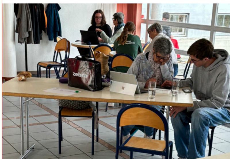
Atelier informatique, le 14 septembre à Châbles